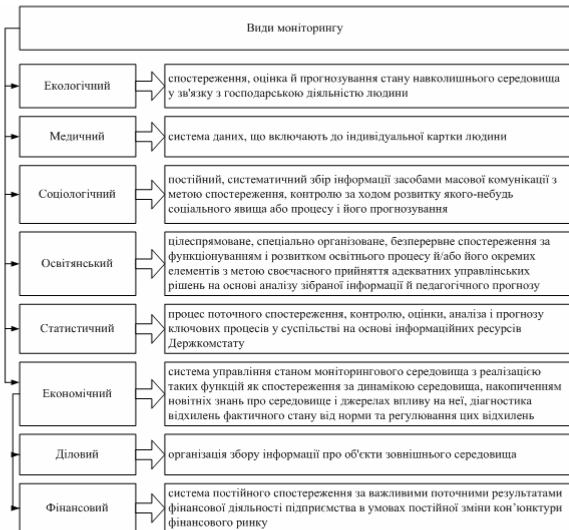
Рис. 1. Види моніторингу по відношенню до різних сфер діяльності

Протягом останніх років концепція поглядів на сутність категорії «моніторинг» зазнала певних змін. Сучасні концепції моніторингу розглядають його по відношенню до різних сфер діяльності і виокремлюють такі його види: екологічний, медичний, соціологічний, освітянський, статистичний, економічний тощо (рис.1).