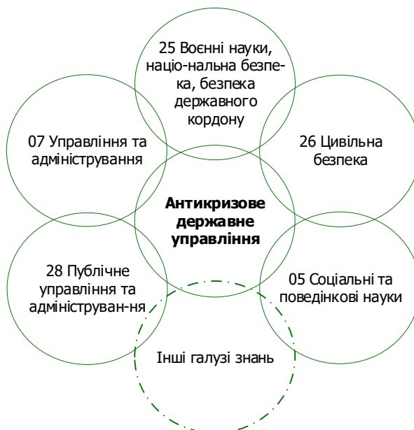
Рис. 1. Взаємозв'язок міждисциплінарного освітнього напрямку «Антикризове державне управління» з іншими галузями знань.

Правові прогалини. Згідно з ч. 5 ст. 9 Закону України «Про вищу освіту», заклади вищої освіти (наукові установи) самостійно розробляють і затверджують освітні програми з урахуванням вимог до відповідного рівня вищої освіти, установлених законодавством та стандартами вищої освіти [16]. Водночас у ч. 1, 2 ст. 10 Закону України «Про вищу освіту» визначено, що стандарт вищої освіти – це сукупність вимог до освітніх програм вищої освіти, які є спільними для всіх освітніх програм у межах певного рівня вищої освіти та спеціальності. Стандарти вищої освіти розробляють для кожного рівня вищої освіти в межах кожної спеціальності відповідно до Національної рамки кваліфікацій, їх використовують для визначення й оцінювання якості вищої освіти та результатів освітньої діяльності закладів вищої освіти (наукових установ), результатів навчання за відповідними спеціальностями [16].