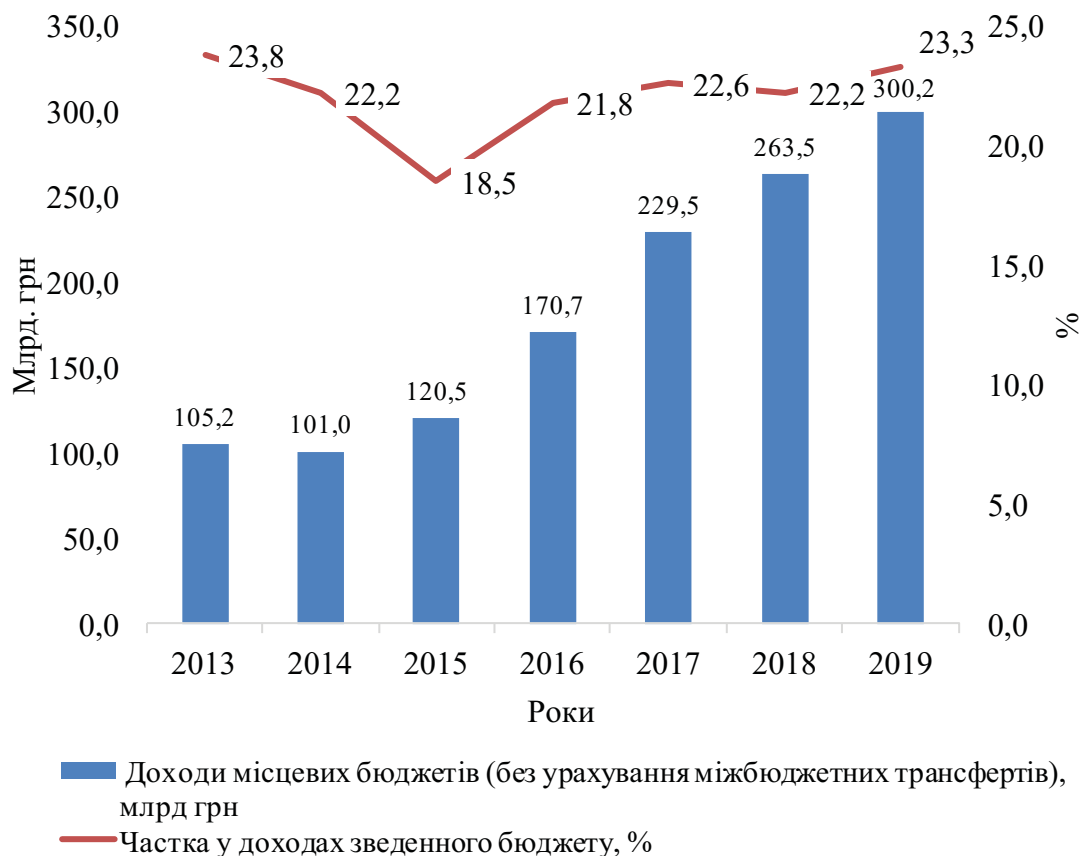
Рис. 2. Статистика доходів місцевих бюджетів та їхня частка у зведеному бюджеті України за 2013—2019 рр.

За офіційними даними Міністерства фінансів України і Державної казначейської служби України, частка місцевих бюджетів у зведеному бюджеті України становить у середньому 22,2—23,3 % і має тенденцію до зниження у порівнянні з 2013 роком (рис. 2). З 2015 року спостерігається зростання до 2019-го, проте це зростання (23,3 % 2019-го) не перевищує показника 2013 року (23,8 %).