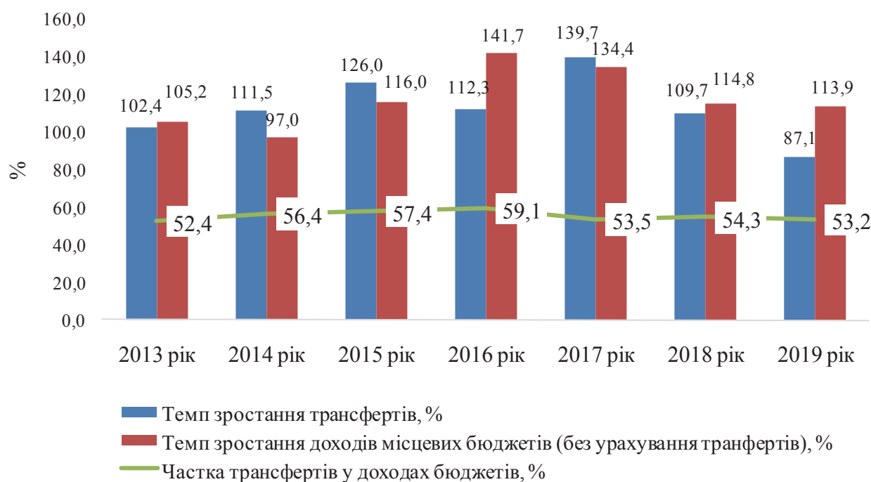
Рис. 1. Статистика темпів зростання трансфертів і доходів місцевих бюджетів (без урахування трансфертів) за 2013—2019 рр.

Частка офіційних трансфертів у доходах місцевих бюджетів протягом аналізованого періоду мала тенденцію до постійного зростання. Так, протягом 2013—2019 рр. вона була в межах 52,4—59,1 %. Така тенденція свідчить про залежність від центру та неможливість органів місцевого самоврядування самостійно забезпечувати регіональний розвиток (рис. 1).