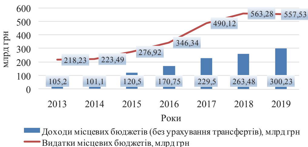
Рис. 3. Статистика бюджетних показників за 2013—2019 рр.

Водночас видатки місцевих бюджетів поступово збільшуються (рис. 3).