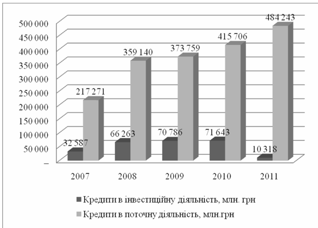
Рис. 4. Порівняльна діаграма кредитних операцій банків України. [7]

Нижче, на рис. 4 зображена порівняльна діаграма кредитування інвестиційної та поточної діяльності: