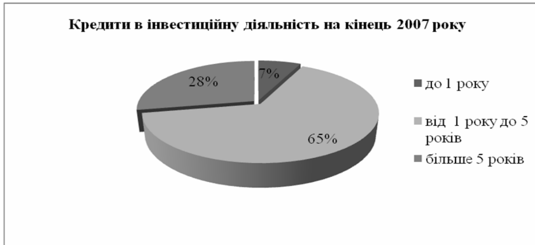
Рис. 2. Структура кредитів в інвестиційну діяльність на кінець 2007 р. [7]

Порівняємо структуру кредитування інвестиційної діяльності на кінець 2007р. і на кінець 2011р. Нижче поданий рис. 2, який ілюструє структуру інвестиційних кредитів у 2007 році: