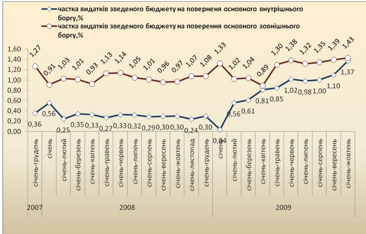
Рис. 2 Динаміка частки видатків зведеного бюджету на погашення основного державного боргу України у 2007-2009рр., % Джерело даних: Міністерство фінансів України

Водночас, активне запозичення державою фінансових ресурсів на зовнішньому та внутрішньому ринках закріплює додаткове боргове навантаження на бюджети наступних періодів. Так, видатки на погашення безпосередньо боргу (без сплати відсотків за його обслуговування) у державному бюджеті вже сягнули рекордного для останніх років рівня (рис.2) і з урахуванням зростаючого як внутрішнього, так і зовнішнього державного боргу продовжуватимуть зростати.