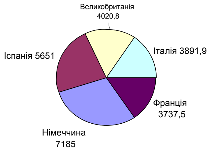
Рис. 2. П'ять країн Європи, де живе найбільше іноземців [2, с. 7]

Дана діаграма свідчить, що основна кількість іноземців (приблизно 75%) мешкають лише у п'яти країнах Європи: Німеччині, Іспанії, Великобританії, Італії та Франції. Одна з причин саме такого розташування мігрантів у тому, що ці 5 країн є найкрупнішими в Європі. Вихідців з України високо цінують роботодавці на Заході. Наприклад, не дивлячись на складні умови існування ринку праці у Великобританії під впливом світової фінансово – економічної кризи, звільняти українців британці не збираються, пояснюючи це тим, що українці працелюбні, толерантні у випадках виконання термінової роботи, відповідальні й згодні працювати за відносну невелику заробітну платню (90 фунтів стерлінгів на день). [1].