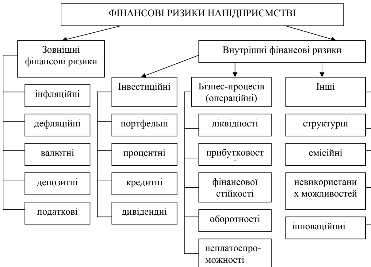
Рис. 1. Класифікація фінансових ризиків підприємства за видами

Фінансовий ризик – це ймовірність виникнення непередбачених фінансових втрат у ситуації невизначеності умов фінансової діяльності підприємства. На основі опрацьованих джерел виділена така класифікація фінансових ризиків за видами (рис. 1): [2, 7].