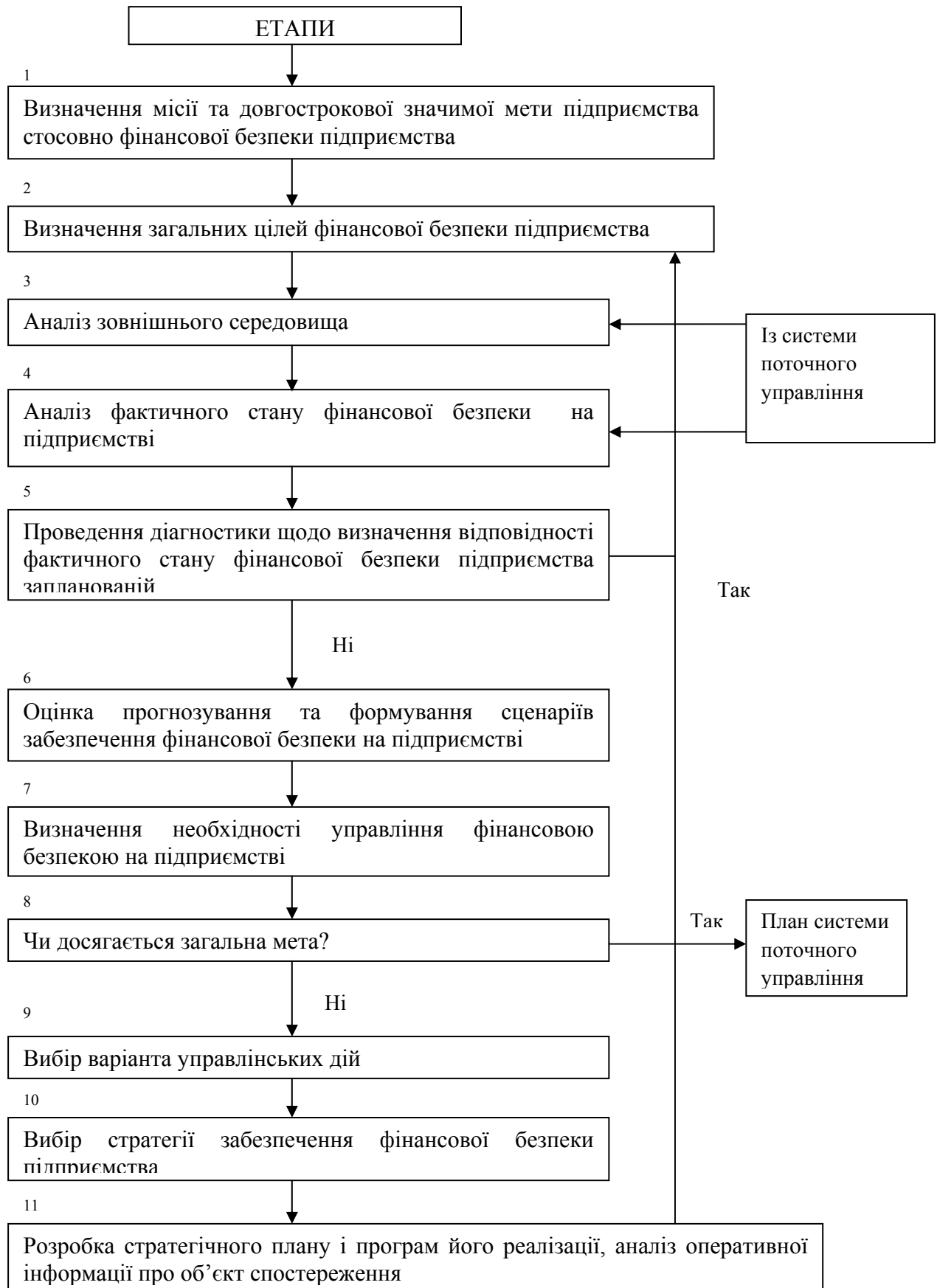
Рис. 1. Структурна схема методичних рекомендацій щодо розробки стратегії забезпечення фінансової безпеки підприємства