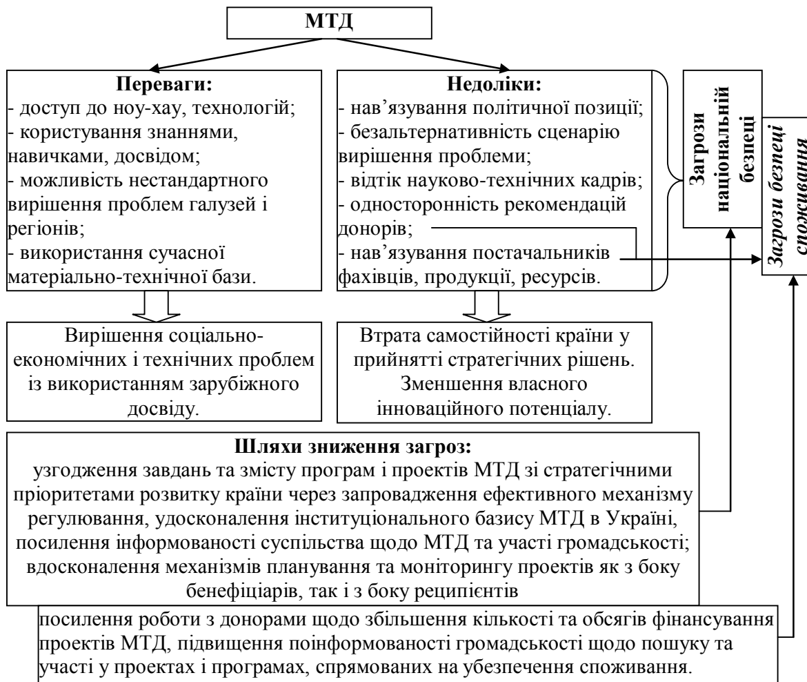
Рис. 2. Структурно-функціональна побудова МТД в системі національної безпеки України *)