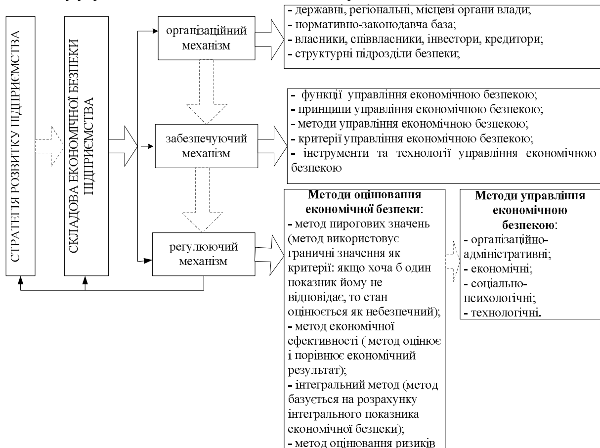
Рис. 1. Формування механізму управління економічною безпекою підприємства [виконано автором]

Необхідність функціонування регулюючого механізму визначається на основі оцінювання рівня економічної безпеки. За умови відхилень, що формують загрози, приймаються рішення щодо активізації відповідних інструментів, здатних поліпшити ситуацію до прийняттого рівня. Таким чином, функціонування механізму управління економічною безпекою промислових підприємств слід розглядати як сукупність управлінських процедур, що формують способи взаємодії їх інтересів з інтересами суб'єктів зовнішнього і внутрішнього середовища, за допомогою яких, з урахуванням особливостей діяльності, забезпечуються результати діяльності, достатні для перебування підприємств в економічній безпеці. На рис. 1 зображено основні складові механізму управління економічною безпекою підприємства.