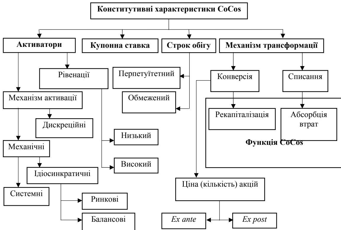
Рис. 1. Анатомія умовних конвертованих боргових цінних паперів 1 1 Примітка. Власна розробка автора.

Системні індикатори відображають стан фінансової системи чи окремого сектору і при сигналі про значне погіршення фінансових умов здійснюється конверсія. Недоліком застосування виключно системних індикаторів є неврахування фінансового стану конкретного банку, який може виявитися доволі стійким і низько чутливим на макрофінансові потрясіння, а необґрунтована конверсія боргового капіталу в акціонерний може бути негативним сигналом для ринку і спровокувати погіршення платоспроможності банківської інституції. З іншої сторони, системні індикатори можуть ідентифікувати негаразди у фінансовій системі запізно, коли банк вже доволі важко буде вивести з дисфункціонального стану.