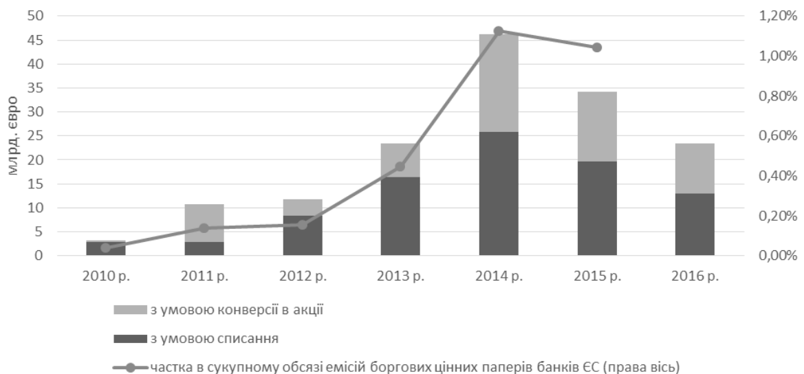
Рис. 4. Динаміка емісії умовних конвертованих облігацій в Європі 1

Ринок CoCos за обсягами емісій є ще доволі мізерним. Перші цінні папери такого типу були емітовані в грудні 2009 році банком Lloyd's обсягом 7 млрд. фунтів стерлінгів для включення до капіталу TIER-1 з умовою конверсії на акції [10, с. 40]. Кумулятивний обсяг емісій CoCos банками Європи за 2010-2016 рр. склав 153,2 млрд. євро. Частка емісій умовних конвертованих облігацій банками Європи (включаючи і не членів ЄС) в загальному обсязі емісій усіх боргових інструментів монетарними фінансовими інституціями ЄС в 2015 році становила лише близько 1% (рис. 4).