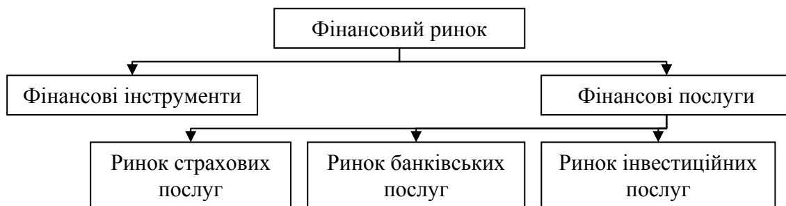
Рис. 1. Структура і місце фінансових послуг на фінансовому ринку

Згідно з Класифікацією послуг зовнішньоекономічної діяльності (ДК 012–97) [3], розробленою на основі Класифікатора видів економічної діяльності статистичної Комісії Європейського Союзу, до послуг, пов'язаних з фінансовою діяльністю, включаються послуги з фінансового посередництва, страхування та допоміжної діяльності у сфері фінансів і страхування (рис. 1).