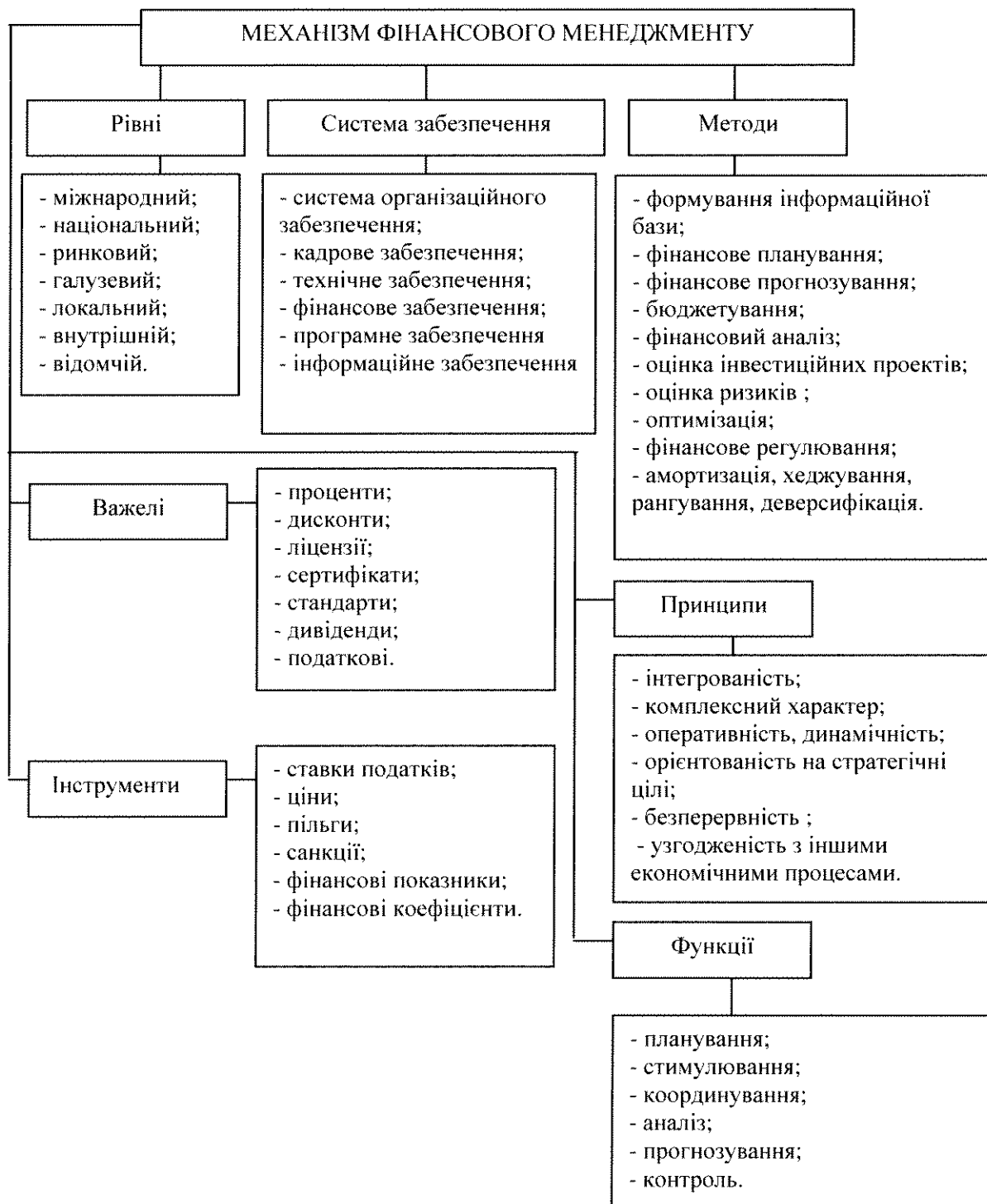
Рис. 1. Узагальнена модель механізму фінансового менеджменту

Поєднуючи погляди авторів відносно складових механізму фінансового менеджменту (табл. 1), побудовано узагальнену модель механізму фінансового менеджменту, складовими якої є рівні фінансового менеджменту, система забезпечення, методи, функції, принципи, важелі та інструменти фінансового менеджменту (рис. 1).